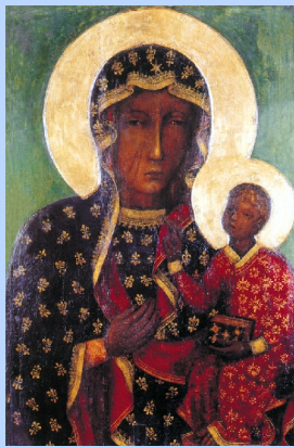
Cudowny Wizerunek Matki Bożej Jasnogórskiej